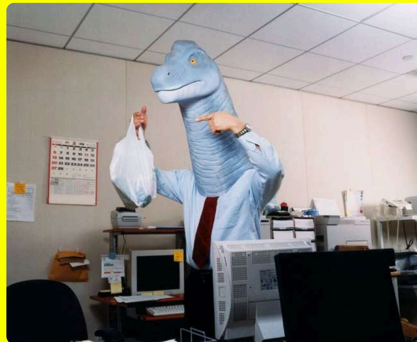
Guerilla Office Stunts