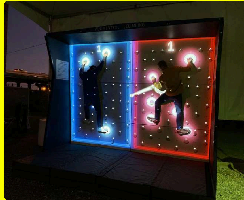
Immersive Games / Arcade