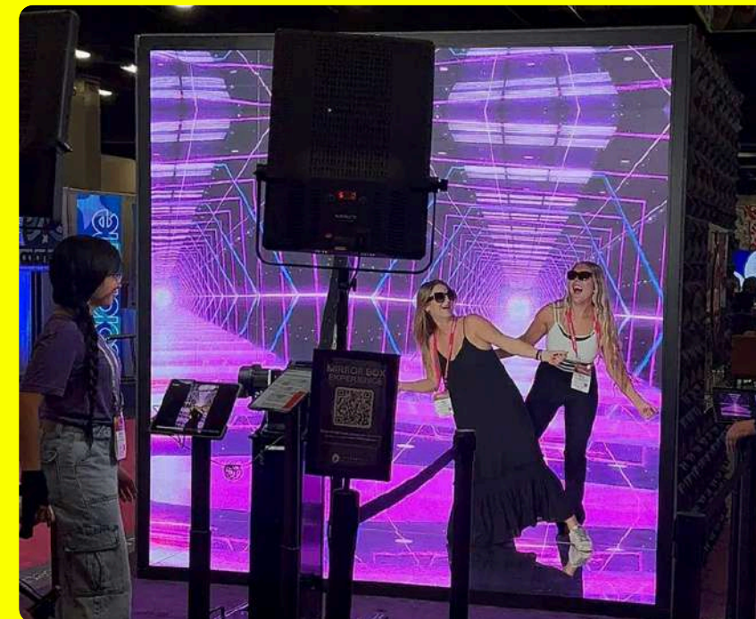
Event/Messe Promotions z.B. Mirror Box