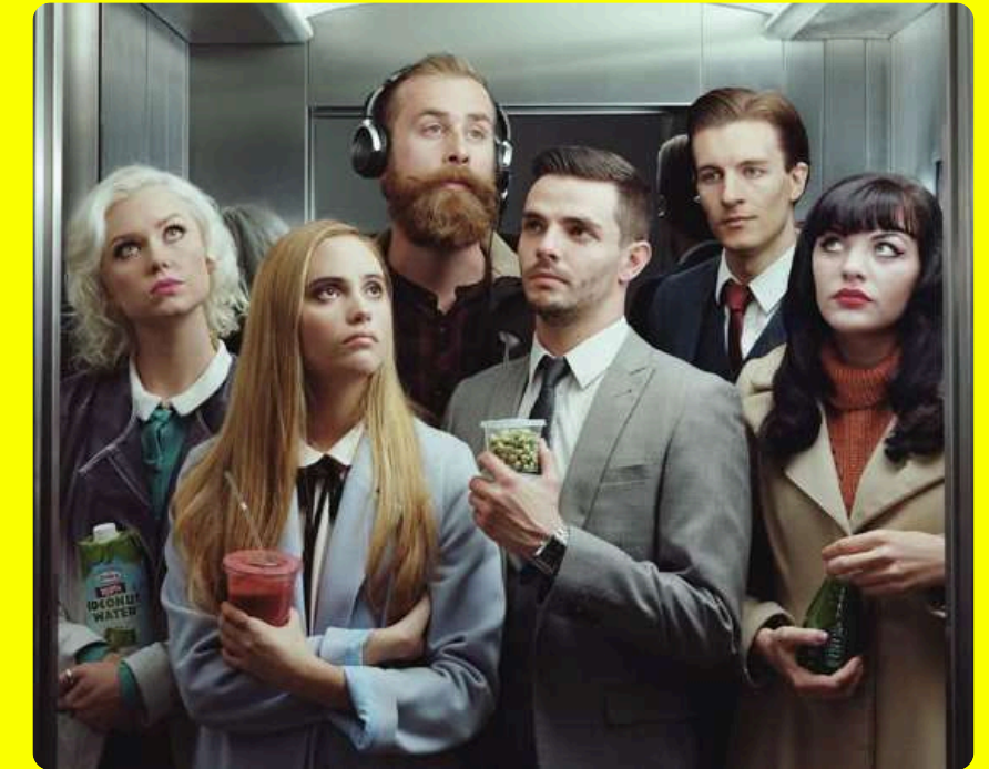
Social Media "Netflix" Serie