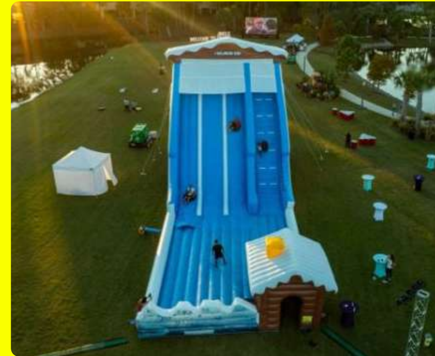
Büro oder Freizeitpark ?