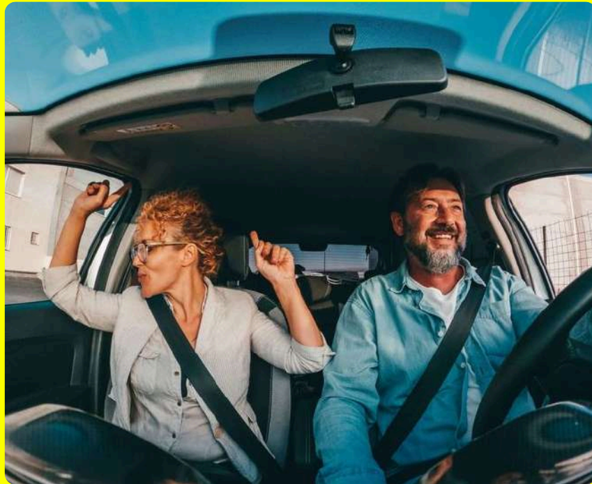
Feierabend Drive in

Wir setzen maßgeschneiderte Konzepte um, die exakt zum Unternehmen passen. ( MA-Anzahl, Kultur und Budget )