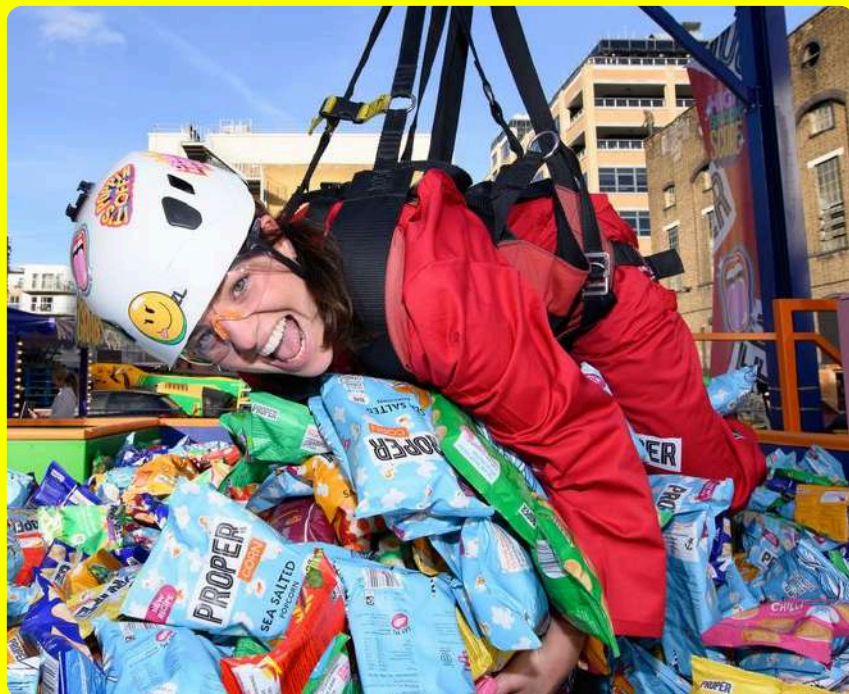
XXL Game Stations z.B. Human Claw Machine